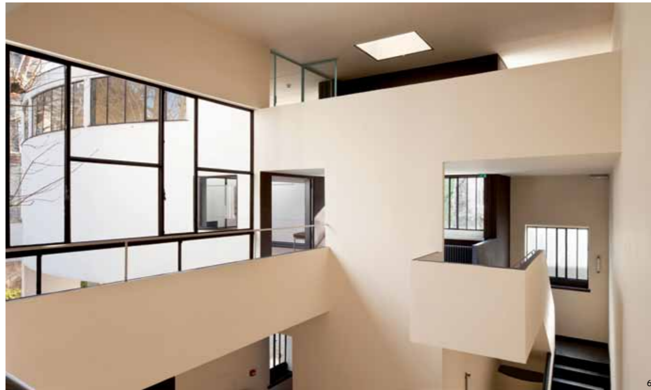
4 — Villas La Roche-Jeanneret, premier plan: dessin de perspective / first sketch: perspective plan 5 — Les maisons La Roche et Jeanneret / La Roche and Jeanneret Houses 6 — Hall et passerelle / Hall and galleried walkway 7 — La salle à manger / The dining room 8 — Galerie d'art / Art gallery