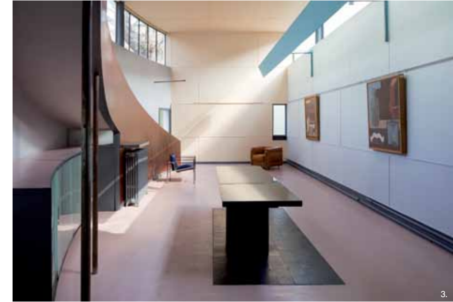
1-3 Olivier Martin-Gambier © FLC/ADAGP