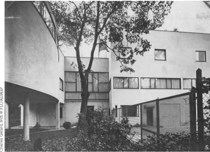
Charles Géraud, 1925 © FLC/ADAGP