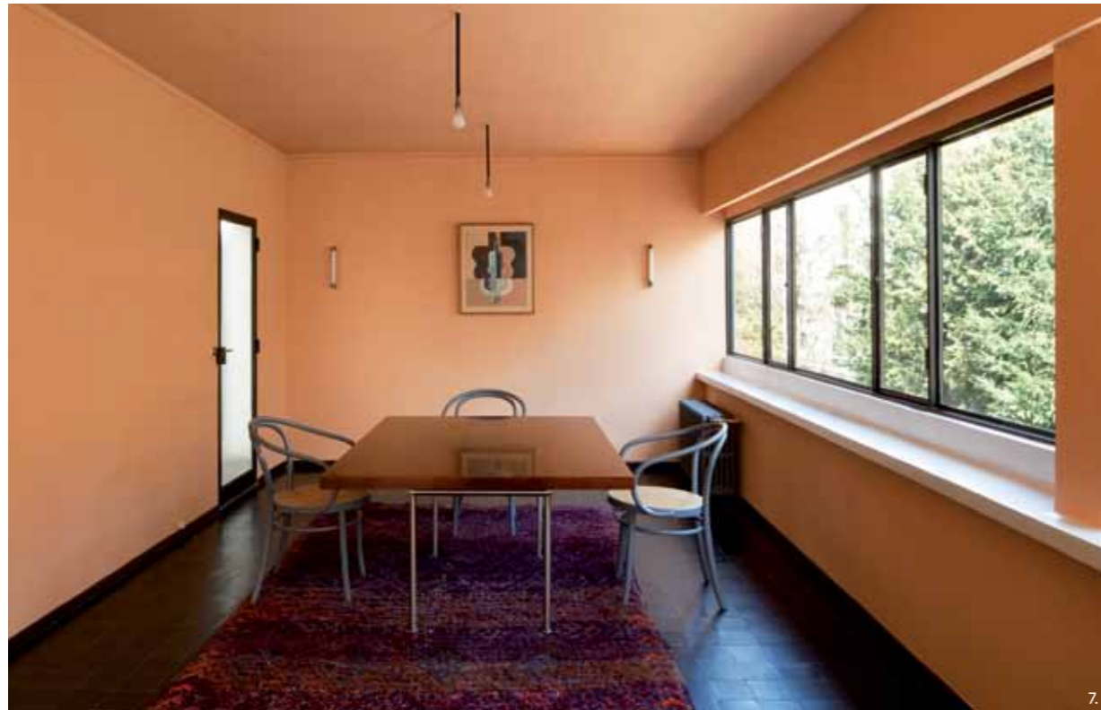
6. # TL